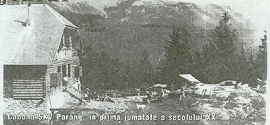
Cabana SKV Parâng, în prima jumătate a secolului XX

Încă de la constituire Asociația SKV a avut în vedere organizarea activității turistice și în Masivul Parâng, unde la sfârșitul secolului XIX a construit una din primele cabane din țară.