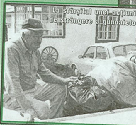
La sfârșitul unei acțiuni de strângere a gunoanelor

În vecinătatea cascadei a fost deversat un camion cu gunoi